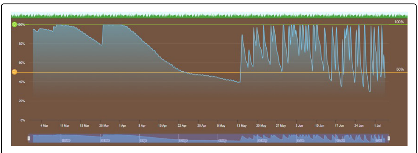
Figura 3. % de Agua Útil en tratamiento WSB (arriba) y en tratamiento Control (abajo).