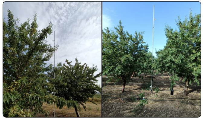
Figura 2. Puntos de monitoreo con sensores climáticos, de humedad de suelo, caudalímetros y cámaras IRT

Por otro lado, con los dos últimos tratamientos (muy extremos) buscamos obtener unas referencias (líneas base) sobre las que generar un índice objetivo , específicamente calibrado para nuestras condiciones de cultivo, que utilizaremos como consigna de riego en la próxima campaña.